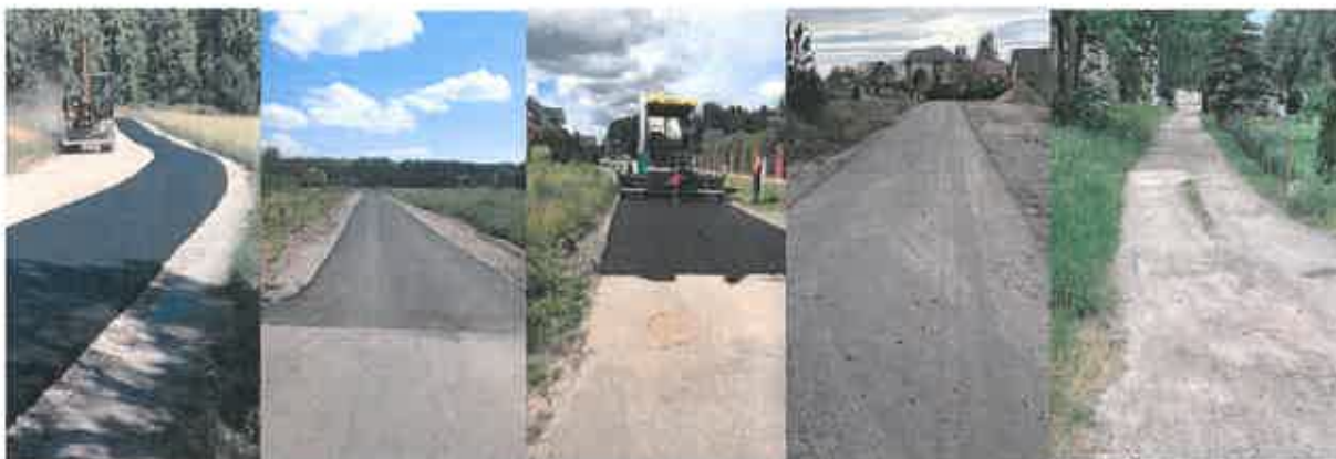
Modernizacje i przebudowa dróg gminnych