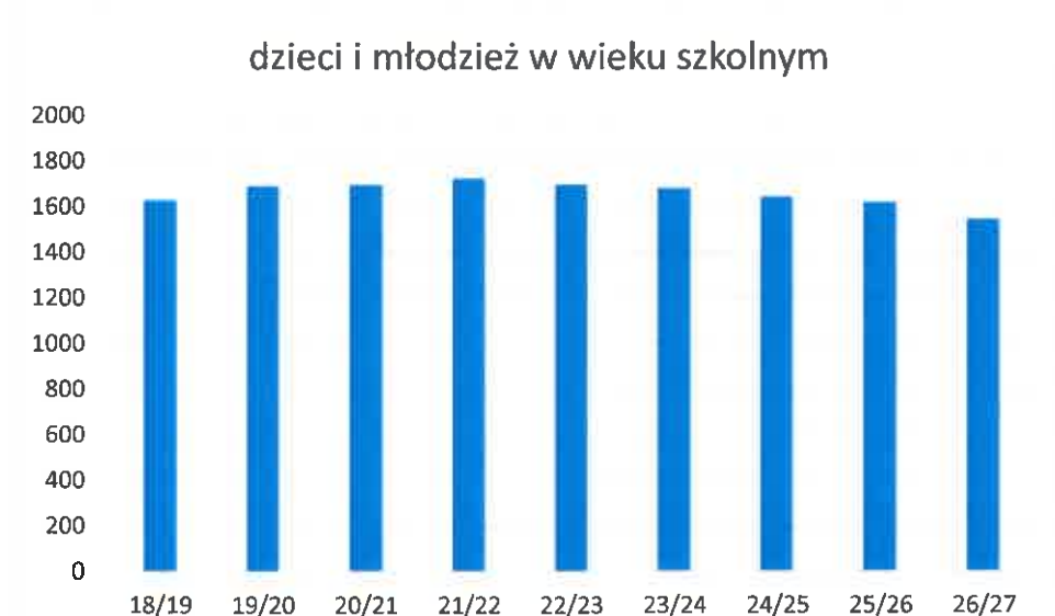
Wykres nr 3: Liczba dzieci i młodzieży w wieku szkolnym