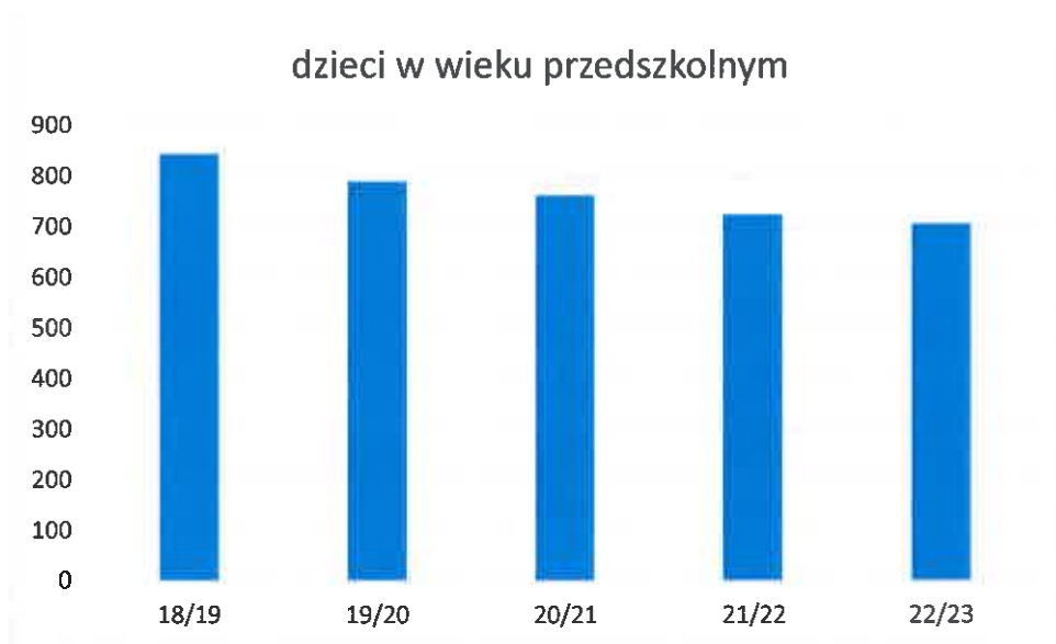
Wykres nr 2: Liczba dzieci w wieku przedszkolnym zameldowana na terenie gminy Słubice.

Na podstawie powyższych danych oszacowano liczbę dzieci w wieku przedszkolnym (dzieci w wieku od 3 do 6 lat) i szkolnym (dzieci i młodzież w wieku od 7 do 14 lat) w poszczególnych latach szkolnych.