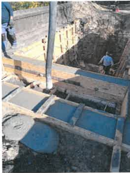
Modernizacja budynku przy ul. Krótkiej