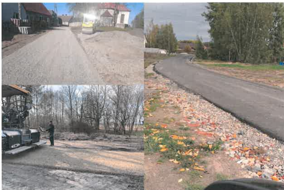
Remont drogi powiatowej z Nowych Biskupic do Rzepina