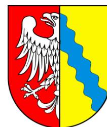
Starosta Słubicki Andrzej Bycka

Przedsięwzięcie dofinansowane ze środków Powiatu Słubickiego.